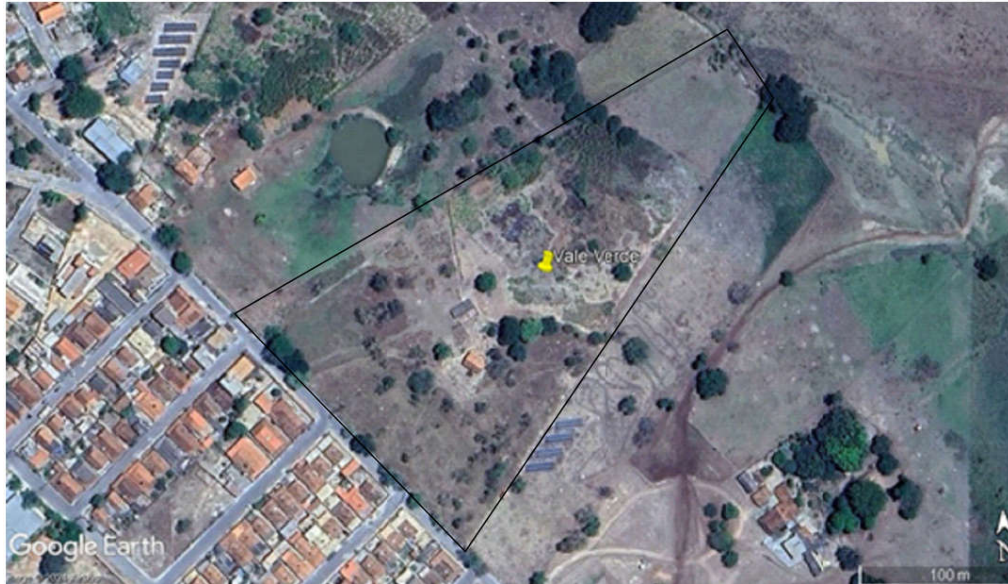
Imagem da área de intervenções (em 2024)