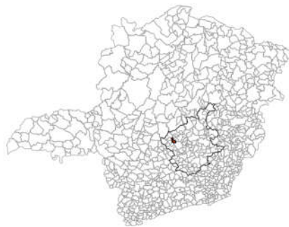
Localização no Estado de Minas Latitude: 19° 33' 40"S / Longitude: 44° 26' 49"W

O acesso é pela BR 040 e MG 238, posterior a Cachoeira da Prata, ou através do Município de Inhaúma ( mais utilizados ).