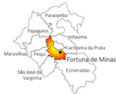
Municípios Limitrofes ao de Fortuna de Minas Latitude: 19° 33' 40"S / Longitude: 44° 26' 49"W