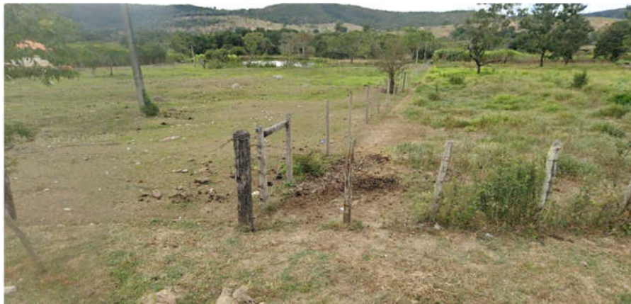
Imagem da área de perfuração do poço tubular profundo, Rua Antônio G. Pinto

O local apresentado para o poço está nas Coordenadas 19°33'52,17" S e 44°26'23,51" O